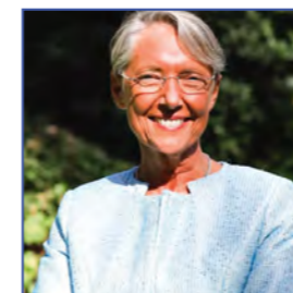
Élisabeth BORNE, Ministre du Travail, de l'Emploi et de l'Insertion