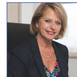
Brigitte BOURGUIGNON, Ministre déléguée auprès du ministre des Solidarités et de la Santé, chargée de l'Autonomie