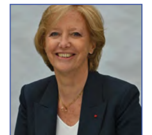
Sophie CLUZEL, Secrétaire d'État auprès du Premier ministre, chargée des Personnes handicapées