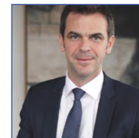
Olivier VÉRAN, Ministre des Solidarités et de la Santé